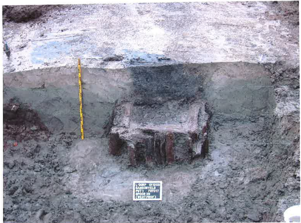
Figuur 8: Waterput Samsonveld

Bovendien doorsnijdt de waterput sedimenten die afgezet zijn op de 9e eeuwse beschoeiingen. De dikte van dit pakket is zodanig dat het onwaarschijnlijk is dat de waterput ook uit de vroege middeleeuwen stamt. Niet alleen is de put aangelegd nadat de lagen zijn afgezet, ook zal de put pas zijn aangelegd nadat de voormalige bedding met stromend water volledig verland was geraakt. Met een nog actieve geul in de 9e eeuw, zelfs zo actief dat beschoeiing en aamplemping met bouw materiaal nodig is, is het niet aannemelijk dat in de 9e tot 10e eeuw dezelfde geul al zover verland is dat een waterput moet worden geslagen.