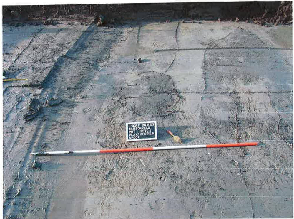
Figuur 7. Amorfe sporen/verkleuringen, put 1, vlak 1 (ArcheoMedia 2003).