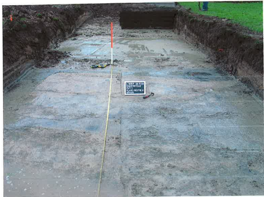
Figuur 4. Horizontale context spoor 18, rechtsboven. De greppelvormige, rechthoekige structuur is met name op de linker helft van de foto zichtbaar (ArcheoMedia 2003).

Kijkend naar veldtekeningen en de foto's dan blijkt zonder meer dat de overige sporen (of fenomenen) zeer amorf zijn. De karakteristieken wijzen in eerste aanblik op natuurlijke verkleuringen. Ook een blik op de vlaktekeningen laat grote amorfe verkleuringen zien. Er is geen eenduidige clustering van fenomenen behalve de 4 kleine ronde mogelijke sporen in werkput 2, vlak 2 (figuur 5) en drie in werkput 1, vlak 1 (figuur 7). Deze sporen hebben mogelijk hun origine in een nederzetting, bijvoorbeeld als paalspoor. Echter, de betreffende fenomenen uit put 2 hebben in het ArcheoMedia onderzoek geen spoornummer gekregen en zijn om voorsnog onduidelijke redenen niet als spoor aangemerkt. Het is op basis van het documentatiemateriaal onmogelijk te zeggen wat de hiervan ouderdom is. De geclusterde ronde fenomenen in put 1 zijn op ca. 40 meter van het hoofdmeetpunt aangetroffen, op enkele meters van de waterput (spoor 29). Ook deze fenomenen zijn door de uitvoerders niet als spoor aangemerkt. De kleur van de vulling wijkt zo zeer af van de omliggende middeleeuwse geulvulling, dat het zeer goed mogelijk is dat deze sporen uit de Nieuwe Tijd dateren. Deze sporen zijn gedocumenteerd in het 2e vlak. Helaas ontbrak in de documentatie een tekening van het eerste vlak van deze opgravingput.