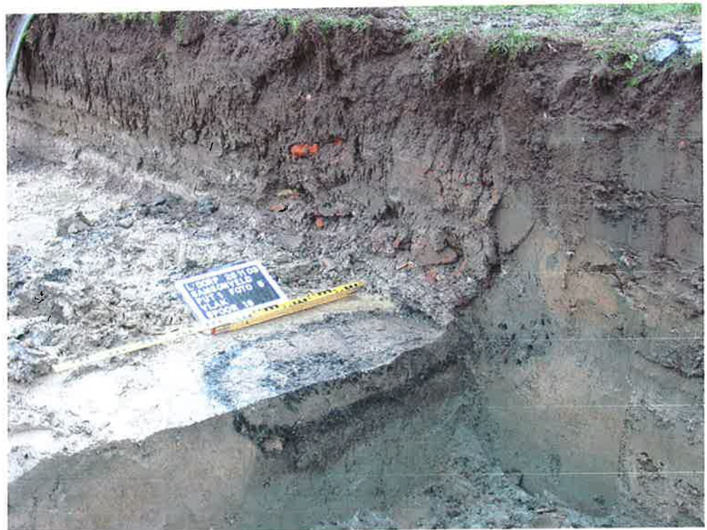
Figuur 2. Verticale context spoor 18 (ArcheoMedia 2003).