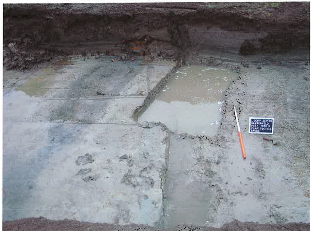
Figuur 6. Rechthoekig spoor, put 1, vlak 1 (ArcheoMedia 2003). Let op de recente verstoring in de profielwand ter hoogte van het spoor