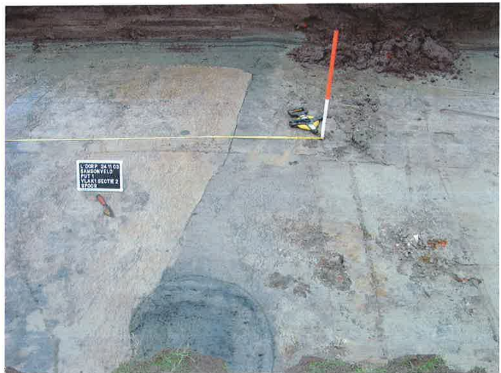
Figuur 3. Horizontale context spoor 18 (ArcheoMedia 2003).