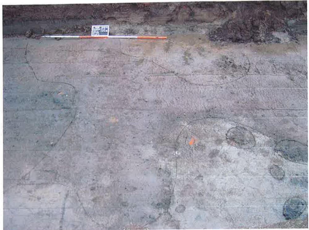
Figuur 5. Sporencluster put 2, rechtsonder (ArcheoMedia 2003).