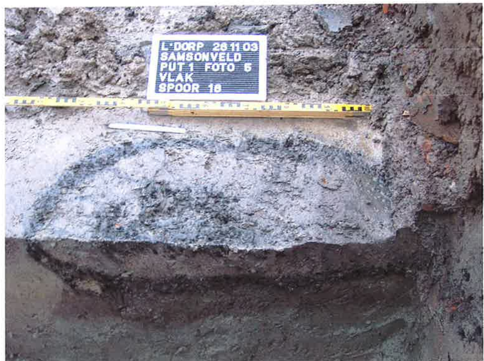
Figuur 1. Coupe spoor 18 (ArcheoMedia 2003).

Dhr. R. Proos liet ter ondersteuning van zijn constatering inzake de vermeende nederzetting één van de ArcheoMedia foto's zien waarop een spoor (spoor 18) zichtbaar is (Zie figuur 1). Het lijkt er echter op dat spoor 18 uit de bouwvoor komt en een directe relatie heeft met een met modern puin gevulde kuil. Wat verder opvalt is dat alleen op de plek waar een dergelijke recente verstoring is aangetroffen ook het vermeende spoor ligt. De aangrenzende lagen zijn, sedimentair gezien, gewoon keurig gelamineerd. Uit de documentatie (zie ook figuur 3) blijkt dat het spoor geïsoleerd is aangetroffen en dat er geen ruimtelijke relatie is met andere sporen. In figuur 3 lijkt het erop dat het spoor onderdeel is van een greppelvormige structuur waarin recent bouw materiaal aanwezig lijkt te zijn.